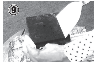
⑨ こびり付いた焦げ等は溶岩石プレートが十分冷めた後金ヘラ等で落とします。