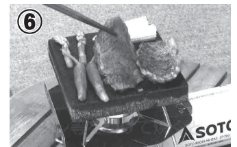
⑥ 食材にはタレ等をつけずに素焼きで焼きます。