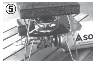
⑤ 強火で約5分加熱した後、弱火で使用します。