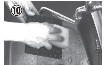
⑩ 洗剤等は使わず、水(湯)で洗い流します。