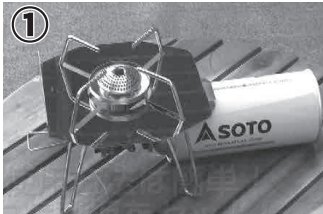
① 遮熱板をセットします。