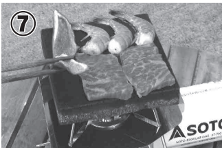
⑦ 肉、野菜、魚介類の他にも多彩な調理に使用できます。