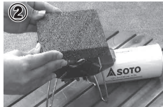
② 溶岩石プレートをゴトクにのせます。