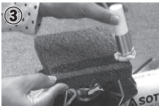
③ ハケ等で全面に油をひきます。