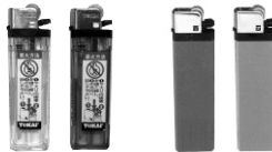
CR-ML-17 (PSC) CR-SPカラード (PSC)